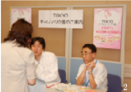
1. 全来場者数は51名。事業者による説明に聞き入る参加者 2. TCKブース。「TOKYOチャレンジ介護」の事業を知らない方には細部にわたってTCKスタッフがガイダンス

説明会の最大メリットは、履歴書を持参すればその場で面接が受けられることです。履歴書を何通送っても書類のみで不合格ということがなく、とにかく自分の良さを相手事業所に直接ぶつけられるということでしょう。このような機会をぜひ利用すべきです。就職が比較的にスムーズにいったという声が多く聞かれるのも合同面接会出席者からです。TCKでは、積極的に合同就職面接会などの情報をお知らせすることによって一日も早い就労へと努力をいたしております。